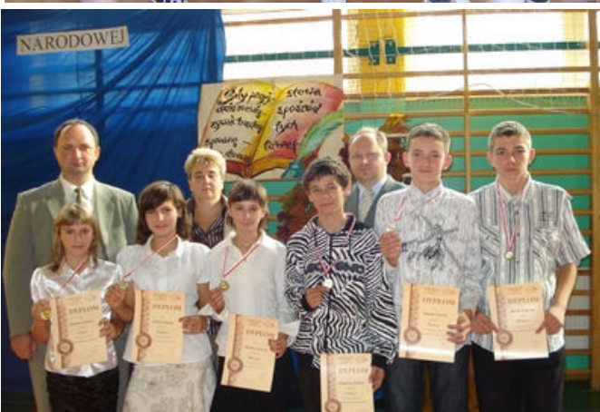
Za zdjęciami po lewej stronie od góry: 1 - podopieczni świetlicy z Piec z Mikołajem; 2 - uczestniczki turnieju kół gospodyń wiejskich; po prawej stronie od góry: 3 - drużyna SP Gaszowice po zwycięstwie w turnieju