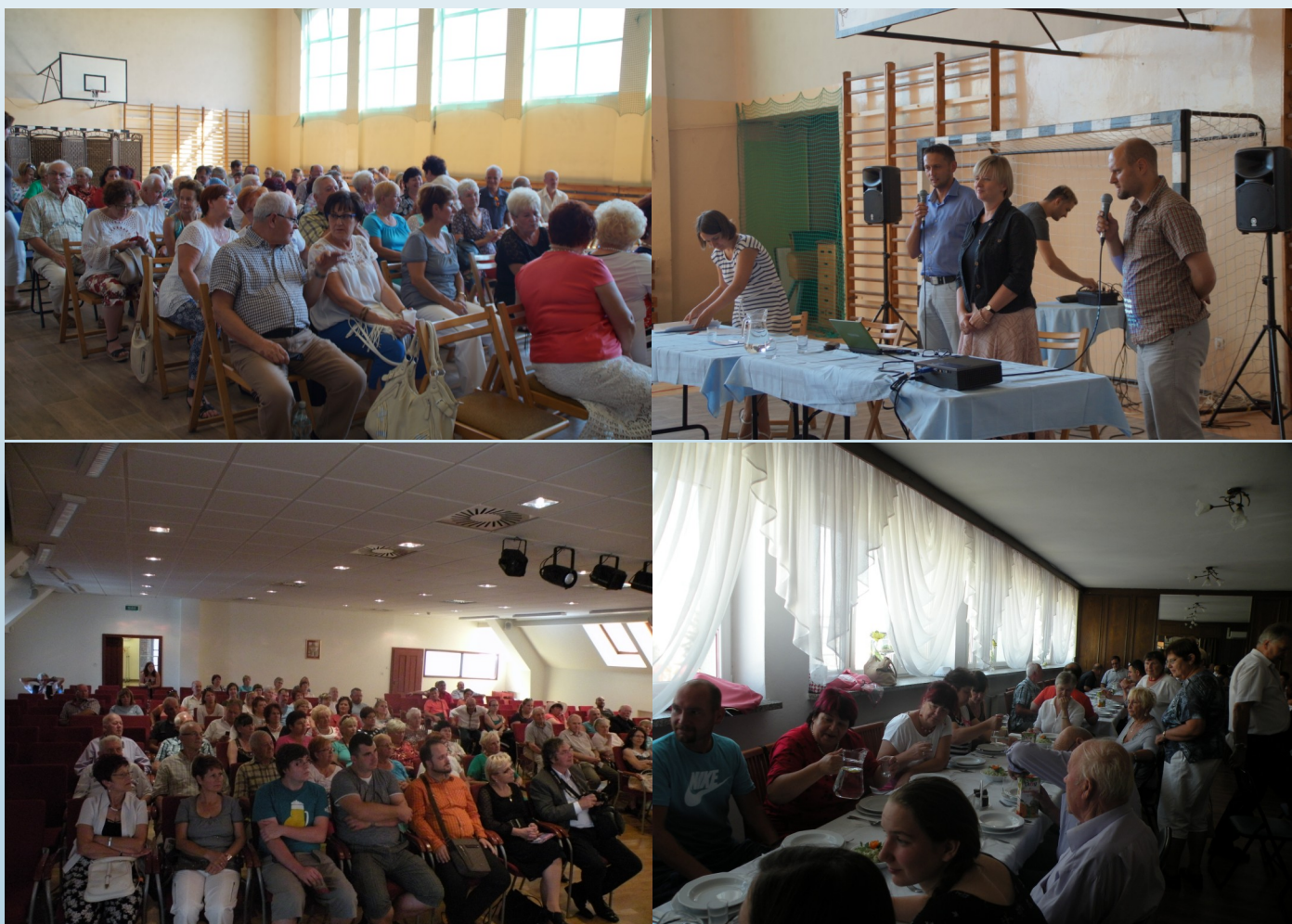
Na zdjęciach foto relacja z projektu „Polubić Europę!”

Całe przedsięwzięcie miało na celu nawiązanie międzynarodowej współpracy, integracji oraz poczucia współodpowiedzialności za politykę UE, szczególnie w kontekście kryzysu migracyjnego. Dziękujemy delegacjom za przybycie i mamy nadzieję, że będą miło wspominać czas spędzony w Polsce, w Gaszowicach. GCI