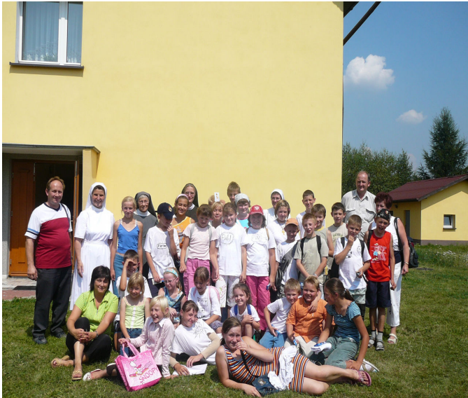
Na zdjęciu uczestnicy półkolonii ze Szczerbic podczas wizyty u sióstr Salwatorianek.

Ośrodek Kultury i Sportu w Gaszowicach organizuje w dniu 26.08.2007r. (niedziela)