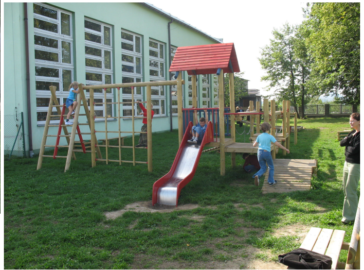
Na zdjęciach : powyżej Kościół pw. Maksymiliana Marii Kolbego, poniżej budynek klubu KS Szczerbice oraz parking przy Szkole; po prawej stronie od góry: 1- OSP Szczerbice, 2 - plac zabaw przy SP Szczerbice.