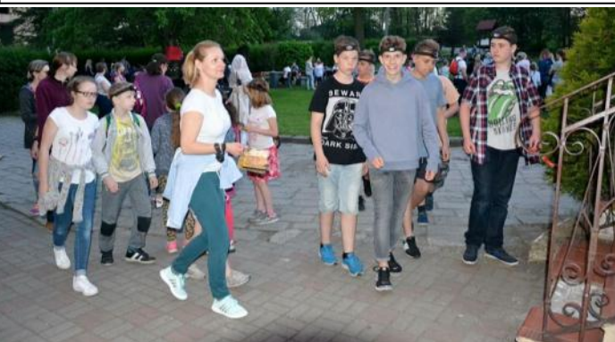
Na zdjęciu: Tłumy na zamku fot. Damian Bizoń.