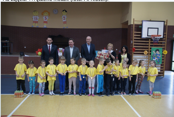
Na zdjęciu: Pamiątkowe zdjęcie przedszkolaków ze Szczerbic. (foto: M. Kłosek).