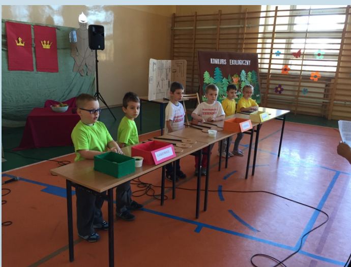
Na zdjęciach: Ekoliada w Szczerbicach.