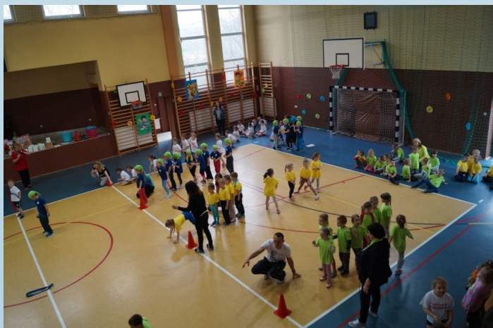
Na zdjęciu: Konkurencje sprawnościowe.