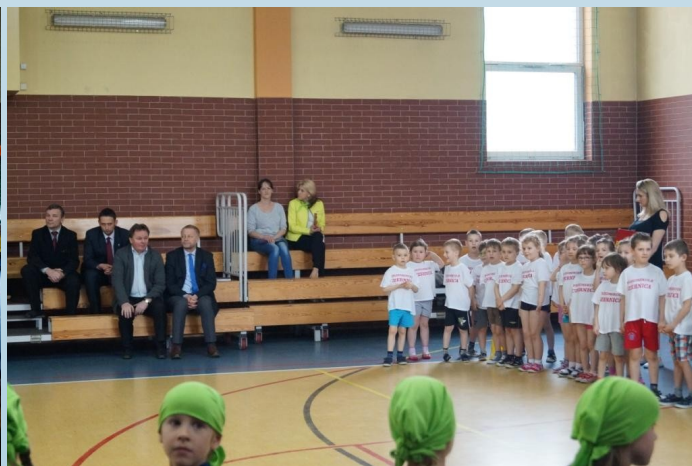
Na zdjęciu: Przygotowania do zawodów, kibicują Wójtowi Gminy Gaszowice oraz Staroście Rybnickiego i Staroście Miasta Bruntal.