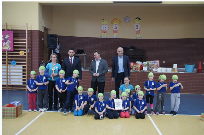
Na zdjęciu: Pamiątkowe zdjęcie przedszkolaków z Bruntala. (foto: M. Kłosek).