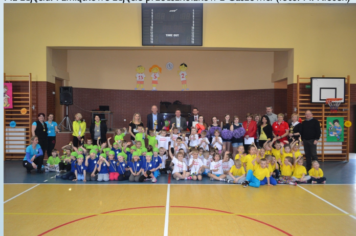
Na zdjęciu: Zbiorowe zdjęcie uczestników Przedszkoliady. (foto: M. Kłosek).