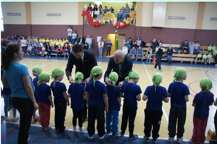
Na zdjęciu: Wręczenie medali.