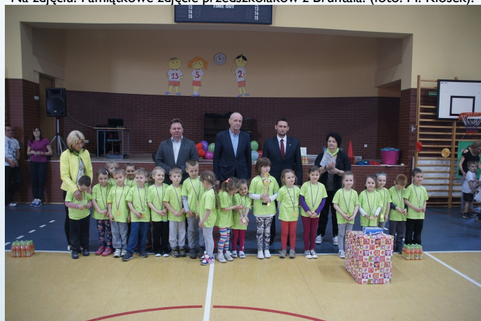
Na zdjęciu: Pamiątkowe zdjęcie przedszkolaków z Gaszowic.