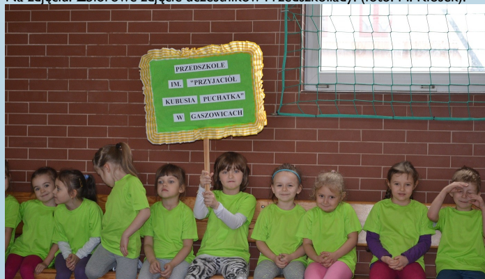
Na zdjęciu: Gaszowickie przedszkolaki w oczekiwaniu na konkurencję.