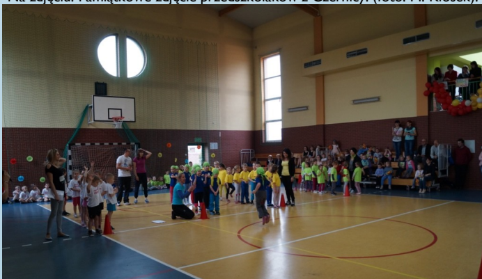
Na zdjęciu: Konkurencje sprawnościowe.