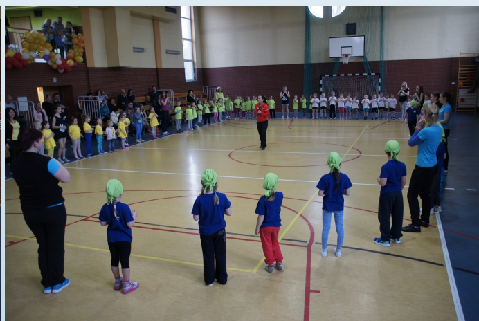
Na zdjęciu: Wspólna rozgrzewka.