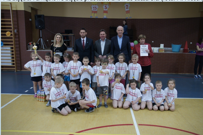
Na zdjęciu: Pamiątkowe zdjęcie przedszkolaków z Czernicy. (foto: M. Kłosek).