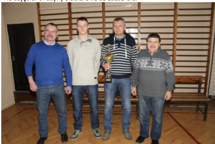
Na zdjęciu: Najlepsi gracze skata turnieju o puchar MCJ.