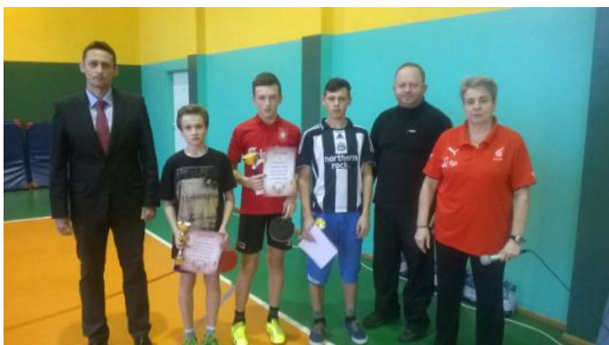
Na zdjęciach: Zwycięzcy turnieju w tenisie stołowym o puchar Wójta, w kategorii gimnazjalnej.