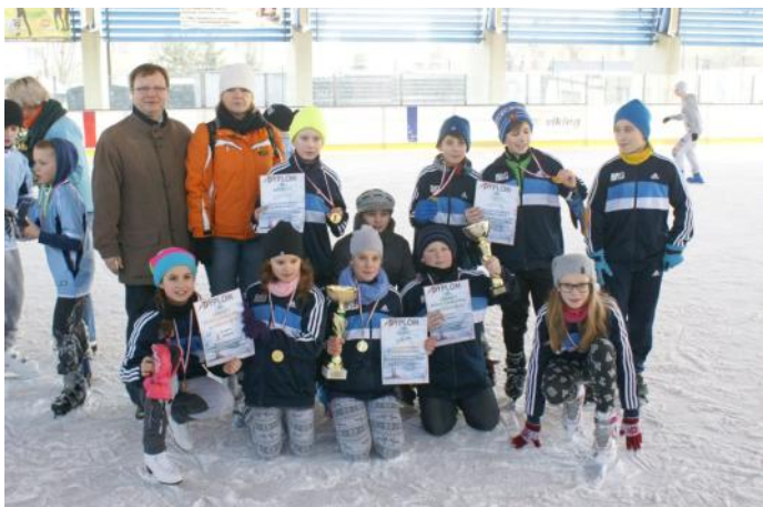
Na zdjęciu: Łyżwiarze reprezentujący Gminę Gaszowice.