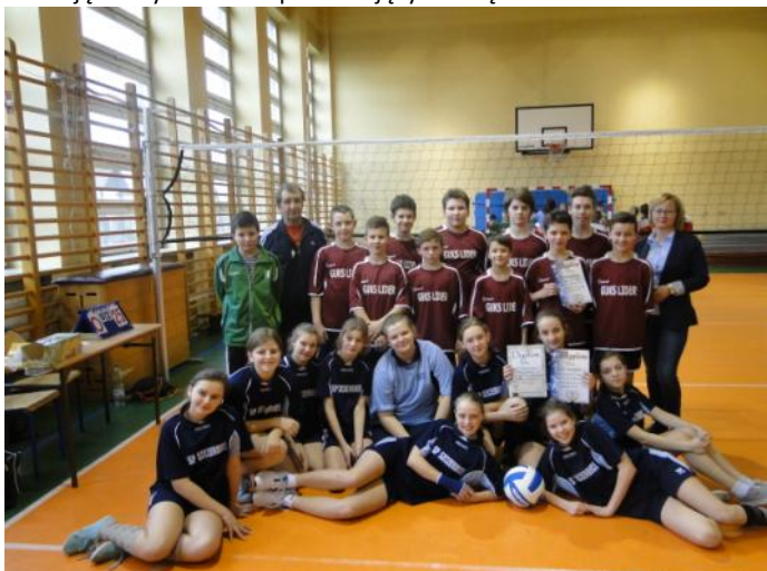
Na zdjęciu: Drużyny siatkarskie ze Szczerbic.