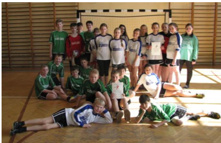
Na zdjęciu: Zawodnicy „szczypiorniaka” z SP Gaszowice.