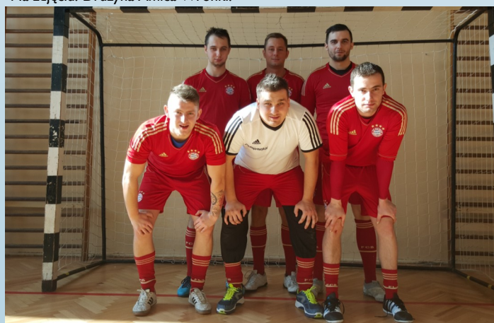
Na zdjęciu: Drużyna Bayeroki.