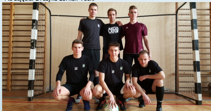
Na zdjęciu: Drużyna Amica Wronki.